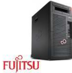
Celsius J550/2 VFY:W5700W17HBES