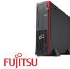
Celsius J550 VFY:J5502W18HBES