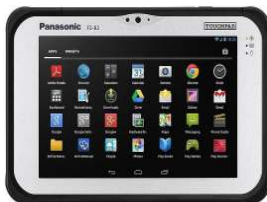
FZ-B2 Mk2 FZ-B2D200CA3