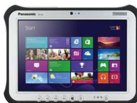
FZ-G1 MK4 STD FZ-G1R6001N3