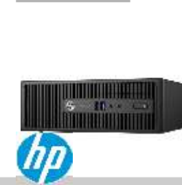
ProDesk600 G2 Z4C36EA