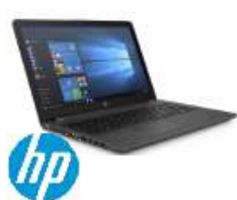
HP 250 G6 1WZ03EA#ABE