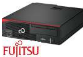
Esprimo D5562 VFY: D5562P15AOES