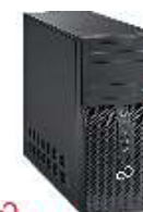
Esprimo P5562 VFY: P5562P15AOES