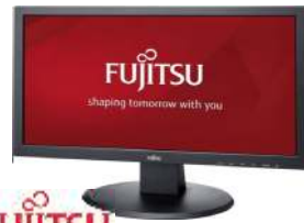
E20T-7 LED, EU S26361-K1538-V161