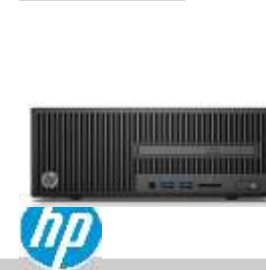
HP 280 G2 Y5P85EA