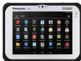
FZ-B2 Mk1 FZ-B2B212FB3