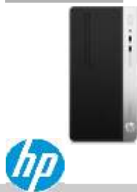
ProDesk400 G4 1JJ66EA