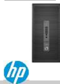
ProDesk600 G2 Z4C37EA