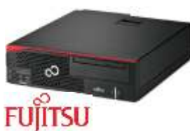
Esprimo D5562 VFY: D5562P15HOES