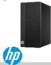
HP 290 G1 1QM93EA