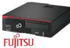
Esprimo D5562 VFY: D5562P15SOES