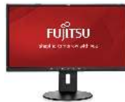
E24-8 TS Pro