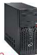
Esprimo P5562 VFY: P5562P13ZOES