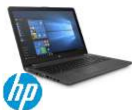
HP 250 G6 1TT45EA#ABE