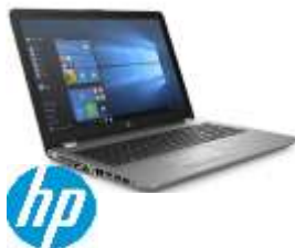
HP 250 G6 1WY77EA#ABE